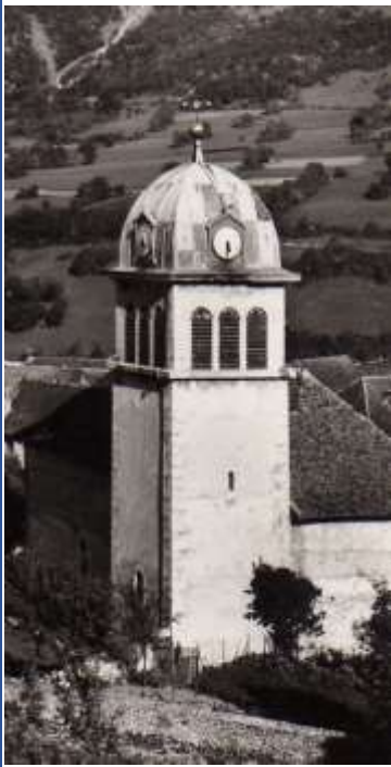
Clocher de 1834

La paroisse a été créée en 1730 et l'église construite sur l'emplacement d'une petite chapelle existante.